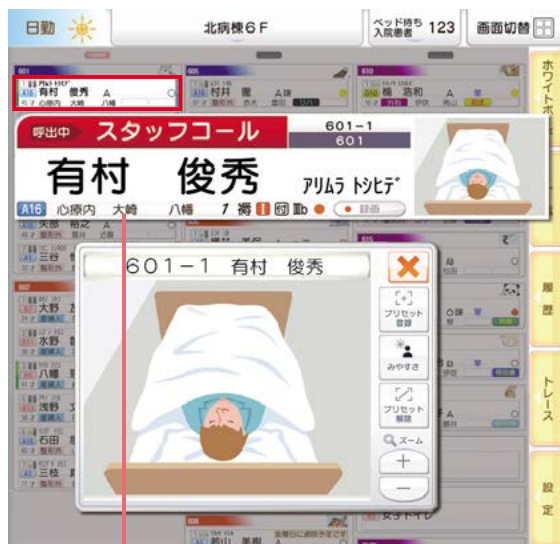
呼出ポップアップ表示

患者さんから呼出があると、対応に必要な患者情報とともに大きくポップアップ表示。呼出先以外はブラックアウトするので、呼出先が一目でわかります。カメラ接続時は映像も大きく表示するので、患者さんの状態把握に役立ちます。