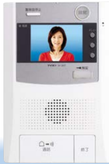
住宅情報盤 VH-3KVT (住戸用自火報設備対応) VHK-3KVT (共同住宅用自火報設備対応)