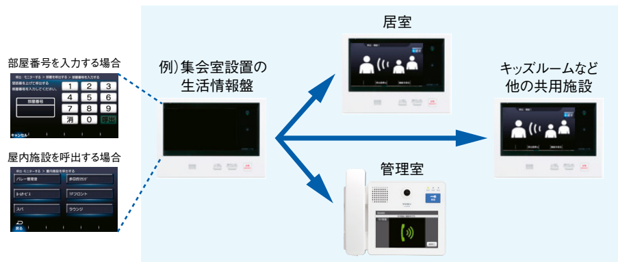
※デザイン・色調・仕様等は予告なく変更する場合があります。