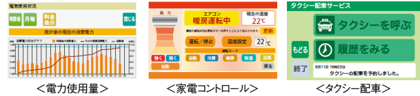
上記コンテンツ表示画面はイメージです。詳細は当社担当者へお問い合わせください。