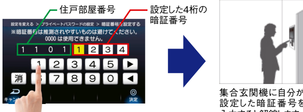
各住戸の生活情報盤で暗証番号を設定

各住戸毎にエントランスオートドアを解錠するための4桁の暗証番号を生活情報盤で設定できます。