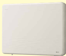
住戸アダプター SDX-AR 希望小売価格 75,000円(税別)