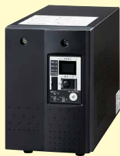
無停電電源装置 SDX-UPS (受70日) 希望小売価格 400,000円(税別)