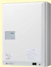
電源装置 SDX-PS (受60日) 希望小売価格 340,000円(税別) ●住戸アダプター10台 まで電源供給可