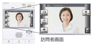
操作のしやすいタッチパネルを採用