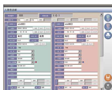
入居者詳細 (お二人入居の場合)