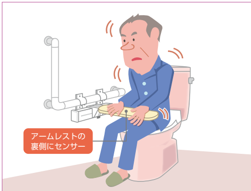
アームレストの裏側にセンサー

アームレストがセットされると、設定された時間の振動が続いたり動きがない場合にセンサーが感知し、ナースコールを呼出。