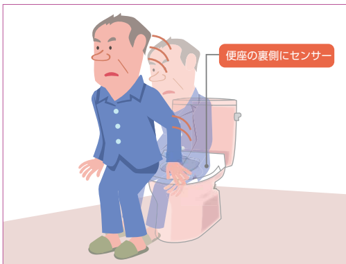
便座の裏側にセンサー

見守りセットした患者(入所者)さんが便座から立ち上がり離れようとする時センサーが感知し、ナースコールを呼出。