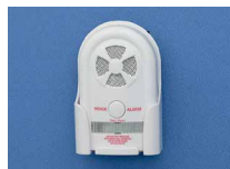
コントロール装置