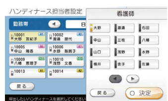
ハンディナーズ担当者設定画面

勤務帯ごとの担当者設定や呼出スライド設定は親機のタッチパネル画面で簡単におこなえます。