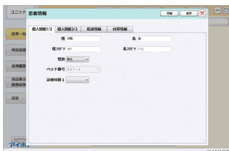
患者 (入所者) 情報画面