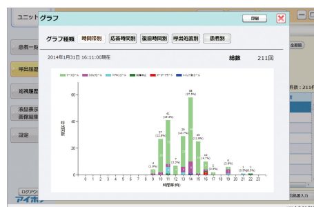
呼出履歴グラフ画面