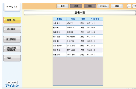
患者 (入所者) 一覧画面