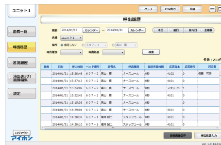
呼出履歴一覧画面