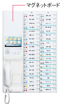
マグネットボード