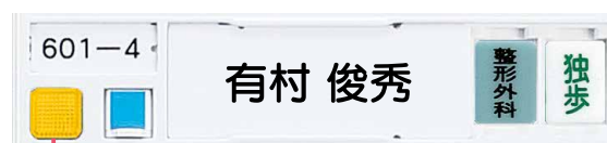
ナースコール呼出(通常呼出)の点灯例

選局ユニット接続時は、オプション(センサー) 接続中と、映像見守りシステム設定中の場合、選局部の緑色表示でお知らせします。