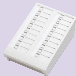
20局用増設選局部 TC-20G 希望小売価格 29,900円(税別)