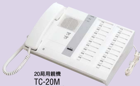
20局用親機 TC-20M 希望小売価格 59,400円(税別)