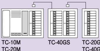
増設選局部の接続のしかた