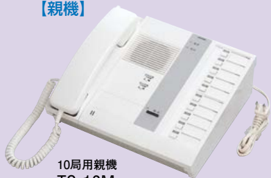
10局用親機 TC-10M 希望小売価格 45,800円(税別)