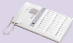
カウンターインターホン 30局組み合わせ例(TC-10M+TC-20G)