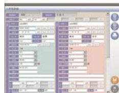
入居者詳細 (お二人入居の場合)