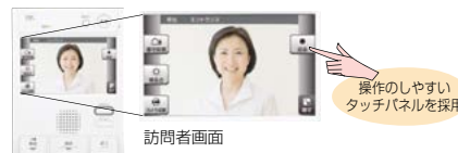
操作のしやすい タッチパネルを採用