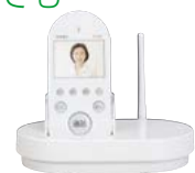
ワイヤレス増設親機 + 中継アンテナ付充電台