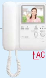
モニター付増設親機 KB-3HRD-T 希望小売価格 69,500円(税別) ●AC電源直結式