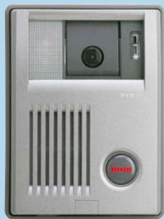
カメラ付玄関子機