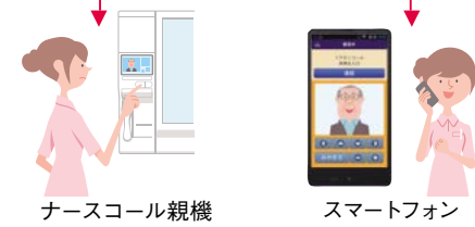
ナースコール親機