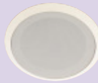
天井埋込型スピーカー NDB-SP-C 30B ¥8,050(税別)