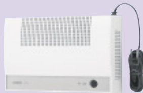
ページングアンプ・10W PG-10C ¥29,800(税別)