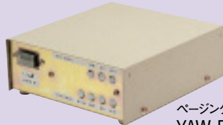
ページングアダプター YAW-RB ¥60,500(税別)