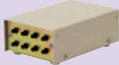
トークバック付アダプター PD-2 ¥12,300(税別)