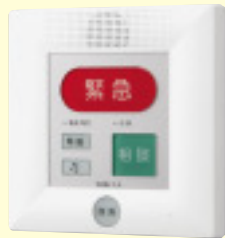
緊急通報装置 FE-M ● 40B ¥68,000(税別)