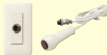
コンセント NBR-1A-C ¥1,850(税別) 呼出握りボタン NBR-8A-C ¥2,450(税別)