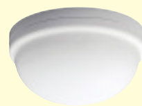
ワイヤレス熱線センサ RIR20 ● 40B ¥35,000(税別) ●天井付型 ※アツミ電気(株)製