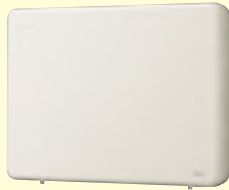
住戸アダプター SDX-AR ¥75,000(税別)