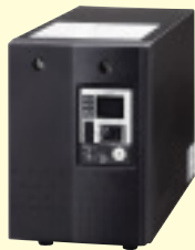
無停電電源装置 SDX-UPS オーダー ¥400,000(税別)