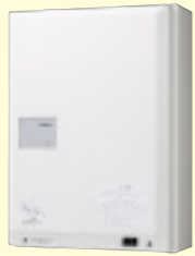
電源装置 SDX-PS オーダー ¥340,000(税別) ●住戸アダプター10台 まで電源供給可