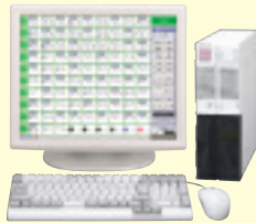
副生活情報監視用パソコン SDX-PCS オーダー