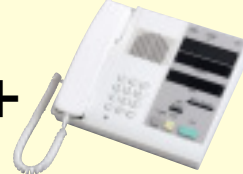
パソコン連動スタッフ親機 SDX-M オーダー ¥235,000(税別)