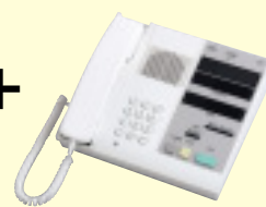
パソコン連動スタッフ親機 SDX-M オーダー ¥235,000(税別)