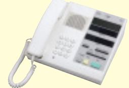
スタッフ親機 SDX-MKR オーダー ¥230,000(税別)