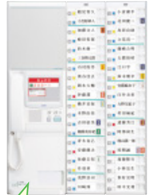
ナースコール親機

アラーム種別 (半角1~8文字) +スペース+ベッド番号 (1~6文字) =合計半角10文字まで