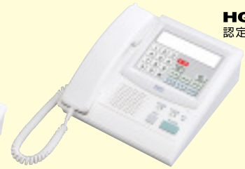
40局用LCD付卓上型親機 NFXV-40M-LC (税別) ¥590,000