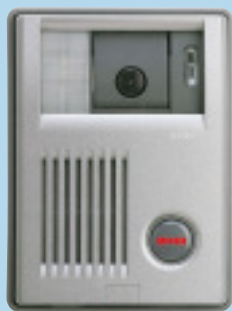
カメラ付玄関子機

テレビドアホンセット KBS-3ARD-T ¥128,000(税別) ●KB-DARとKB-3MRD-Tのセット ●AC電源直結式