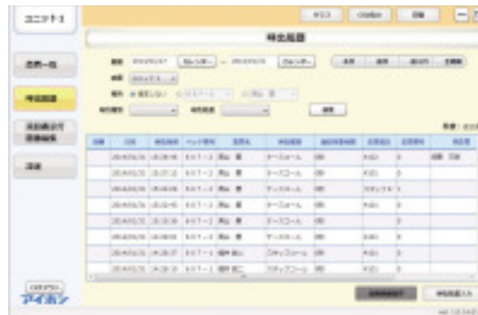
呼出履歴一覧画面