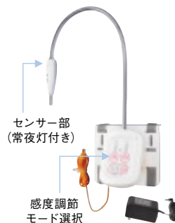
センサー部 (常夜灯付き)