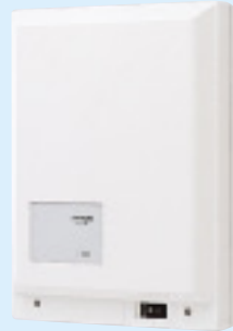
制御装置 VHXW-1XN-1 ¥100,000（税別） ●4系統