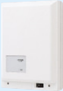
制御装置（映像制御部内蔵） VHXW-1X-1 ¥200,000（税別） ●4系統