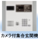
カメラ付集合玄関機