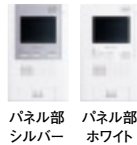
パネル部 シルバー パネル部 ホワイト